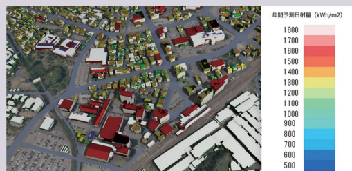
「PLATEAU View 建築物モデル（加賀市）」 ユースケース「太陽光発電ポテンシャル推計」を重ねた様子

現在は約 200都市が無償で自由に使えるオープンデータとして公開されており、石川県内は金沢市、加賀市のデータを利用することができます。